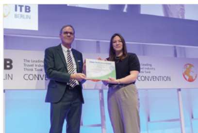
Le 4 mars 2024 à Berlin, Forges-les-Eaux a reçu le Silver Award Green Destinations.